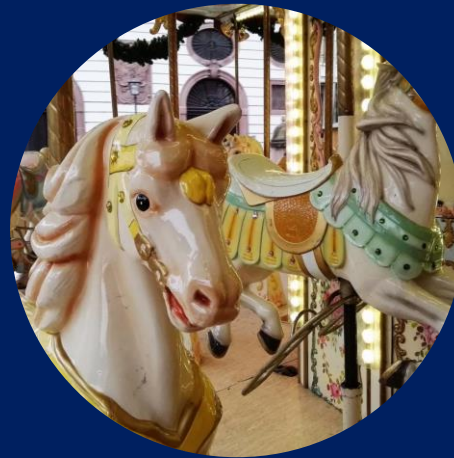
Weihnachtsmarkt 17 Tipps