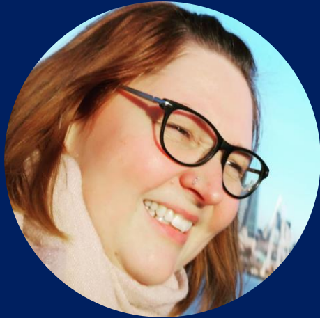
Das bin ich