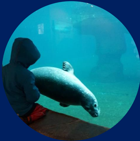
Zoo-Vergleich Kronberg / Stadt