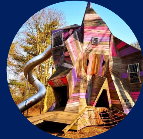
Spielplatz Bad Nauheim